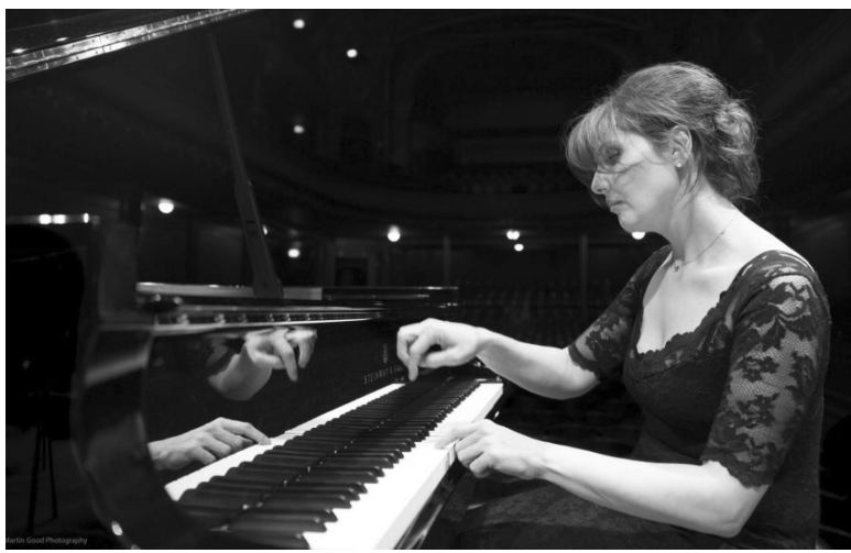
ექვსიოდე წლის წინ ნაიდა მამა, რომელიც ასე ეფერებოდა მშობელ ქართულ მინას:

„ჩვენში კარგ საქმეს არ იფიქრებენ, ბევრი ლექსია ამის თავდები, შენ ამ პატარა ლევიით იწყები, და, ქარიშხლითაც ნუ დამთავრებენ...“ „ფერის თაობას კარგად ახსოვს სატირულ-იუმორისტული ჟურნალი „ნიანგი“, რომელსაც იმჟამად ყველასთვის საყვარელი მწერალი ნოდარ დუმბაძე რედაქტორობდა და ახსოვს ჟურნალის პასუხისმგებელი მდივანი ზაურ ბოლქვაძე, რომელიც ბათუ მელიას ფსევდონიმით აქვეყნებდა ეპიგრამებს და ებრძოდა ცხოვრების მანიკერებს.“