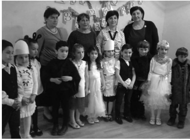
ლიდენ, არამედ მოყვასისა და სამშობლოს სიყვარულს გვიწერავდნენ. ვფიქრობ, ჩემი დისიდენტური ცხოვრების გზა ამ სკოლის პედაგოგების დიდი დამსახურებაა.“ – განაცხაბ

„ვერტყვიჭალის სკოლა ყოველთვის გამორჩეული იყო თავისი პედაგოგებითა და აღზრდილებით. მიხარია, რომ ეს ტრადიცია გრძელდება. აქ ჩვენ არა მარტო საგნებს გვაძლავს-