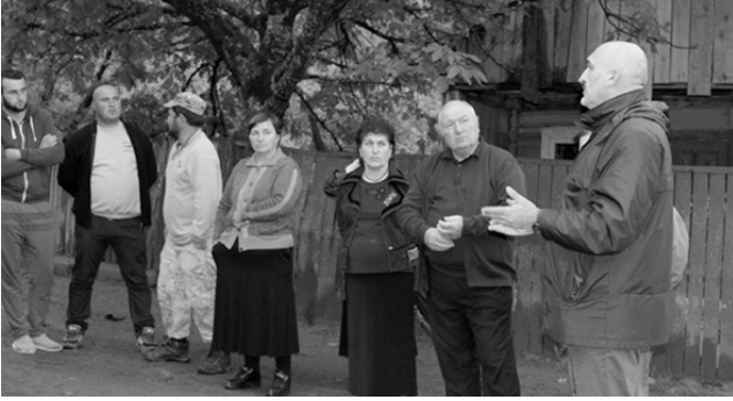
რომ ეს სოციალური მომსახურების სააგენტოს კომპეტენციაში შედის და ადგილობრივი თვითმმართველობა ამ საკითხების გადაწყვეტაში ვერ ერევა. გამგებელი ხაზ-

ნიკოლოზ თოფურაძემ აღნიშნა, რომ ნადაურის გზა მომავლ წელს მოხეტონდება. რაც შეეხება შიდა საუბნო გზებს, გამგებელი ამბობს, რომ ცენტრალური ხელისუფლების პრეროგატივაა 2020 წლისთვის ყველა სოფელში გზა რეაბილიტაციული იყოს. რაც შეეხება ფულადი შემწეობის დანიშვნა-გაუქმებას, თოფურაძე განმარტავს,