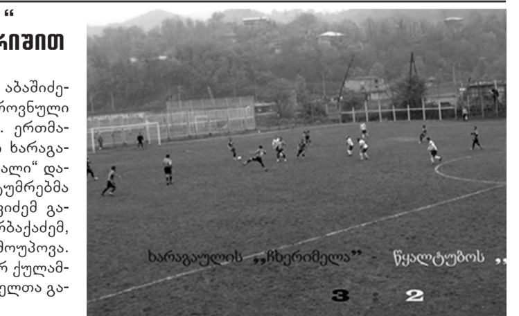
ხარაგაულის „ჩხერიმელა“ წყალტუბოს