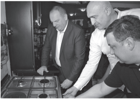
ხარაგაულის მუნიციპალიტეტის სოფლებში გაზიფიცირების სამუშაოები აქტიურად მიმდინარეობს.

მუნიციპალიტეტში გაზიფიცირების სამუშაოები აქტიურად მიმდინარეობს