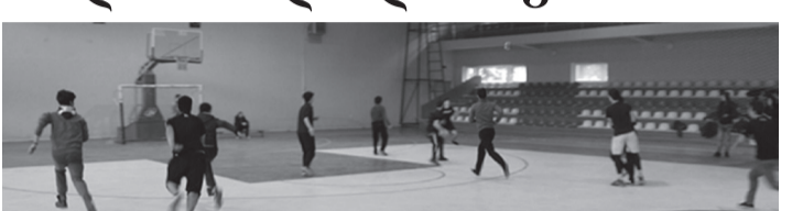
სკოლა გახდა. სასკოლო ოლიმპიადები ქვეყნის მასშტაბით საქართველოს სპორტის სამინისტროს ინიციატივით იმართება. ტურნირის ხარაგაულში გამგეობის განათლების, კულტურის, სპორტისა და ახალგაზრდობის საქმეთა სამსახური, საგანმანათლებლო რესურს-ცენტრისა და „სპორტის განვითარების ცენტრის“ მხარდაჭერით ახორციელებს. კაპ შპვიძე

გოგონათა გუნდში მე-2 საჯარო სკოლამ გაიმარჯვა, ვაჟთა გუნდში კი მე-3 საჯარო სკოლამ, რომლებიც ოლიმპიადის რეგიონალურ ტურში მიიღებენ მონაწილეობას. შემდეგი თამაში 22 თებერვალს ხელბურთში გაიმართა. ტურნირში მონაწილეობა მიიღეს: ვერტყვიჭლის, ზვარის, ხიდრის, ვახანის, ლაშის, მოლითის, ბორითის, დაბის N2, N3 საჯარო სკოლებისა და წმინდა ანდრია პირველწოდებულის სახელობის გიმნაზიის ვაჟთა გუნდებმა. გამარჯვებული დაბის მე-3 საჯარო