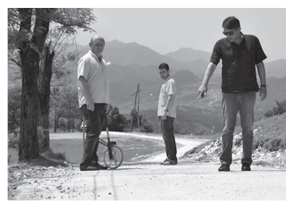
ფარგლებში მობეტონდა ცენტრალური გზის 700 მეტრიანი მონაკვეთი.